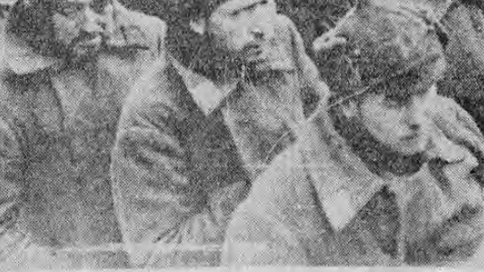
La derrota rusa en el frente de Salla ha tomado grandes proporciones; esta fotografía tomada en un punto cerca del frente de lucha muestra un grupo de prisioneros soviéticos tomados en el sector dicho por las tropas que defienden la libertad de Finlandia.

Por otra parte, la cosecha de café año viene con bastante retraso, ya que apenas si se comenzó a recolectar el grueso de la misma en