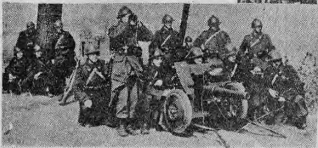
líneas del Mosa, sobre la frontera con Alemania; a la izquierda, maniobras de la artillería belga que está reputada como de la mejor calidad del mundo entero. Como se sabe, Bélgica está en una alerta constante en resguardo de su neutralidad y de la integridad de su territorio.

Arriba: el 10 del pasado enero, en Bruselas, el rey Leopoldo II presencia el desfile de las tropas belgas que van a tomar posiciones a lo largo de las